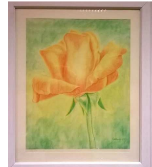
Pietro Bellomo, Maler