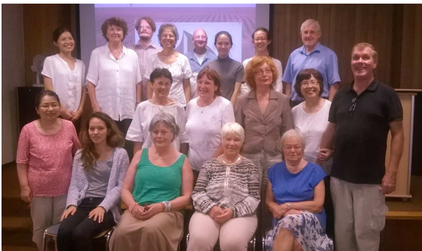
Künstler und Gäste

Die Sonne spricht zu uns mit Licht, Mit Duft und Farbe spricht die Blume, Mit Wolken, Schnee und Regen spricht Die Luft. Es lebt im Heiligtum Der Welt ein unstillbarer Drang, Der Dinge Stummheit zu durchbrechen.. In Wort, Gebärde, Farbe, Klang Des Seins Geheimnis auszusprechen. Hier strömt der Künste lichter Quell. Es ringt nach Wort, nach Offenbarung, Nach Geist die Welt und kündigt hell Aus Menschenlippen ewige Erfahrung. Nach Sprache sehnt sich alles Leben In Wort und Zahl, in Farbe Linie, Ton Beschwört sich unser dumpfes Streben Und baut des Sinnes immer höheren Thron.